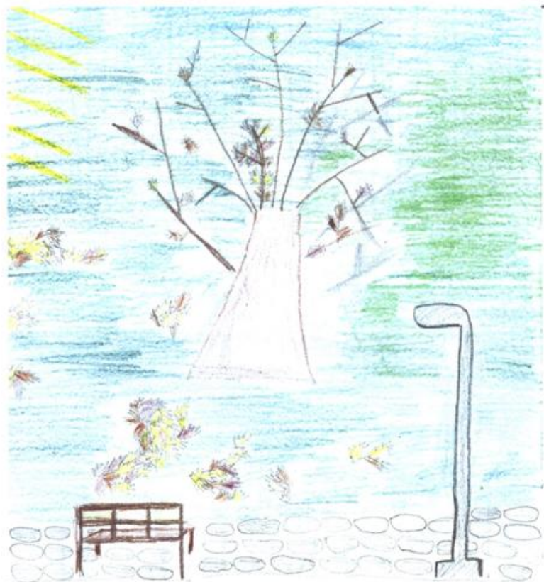
Nakreslil Ondřej Kunštatský (VIII. třída)